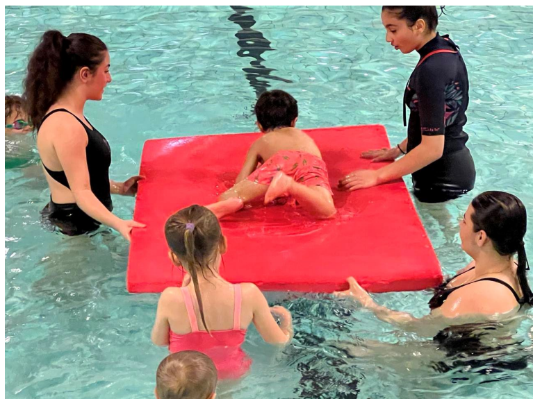
Bild: Simskolan Baddaren undervisningsbassängen isflaksövning

Under året har vi haft tre olika terminer, vår- sommar- och hösttermin.